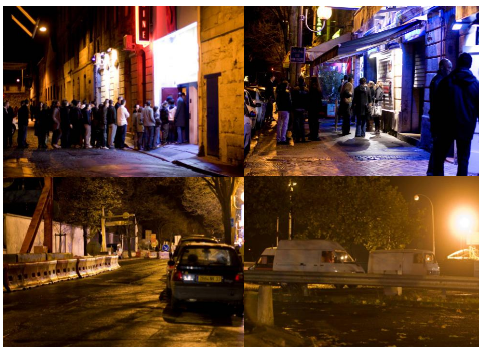
Le quai de Paludate : boîtes de nuit, travaux et prostitution (Clichés : J. Cazzulo).

Le second exemple est le skate parc situé quai des Chartrons, au Nord, un des riches quartiers de la ville. Cet équipement destiné aux jeunes 18 est très peu éclairé la nuit et, de fait, l'utilisation des installations n'est autorisée que jusqu'à 22h. Pour quelles raisons les jeunes ne pourraient-ils pas pratiquer le skate après cette heure? On pourrait avancer différents arguments pour expliquer cette interdiction et donc le manque de lumière: les nuisances sonores (et la fameuse limite des 22h pour le tapage nocturne) ; la sécurité, les dégradations...mais aucun ne s'avèrent vraiment justifiés : le bruit ne semble pas atteindre les