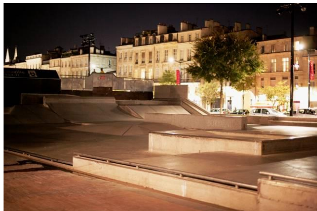
Skate parc peu après l'extinction des lumières à 22h.

considérée comme transgressive par certains, dans une temporalité encore parfois perçue comme subversive.