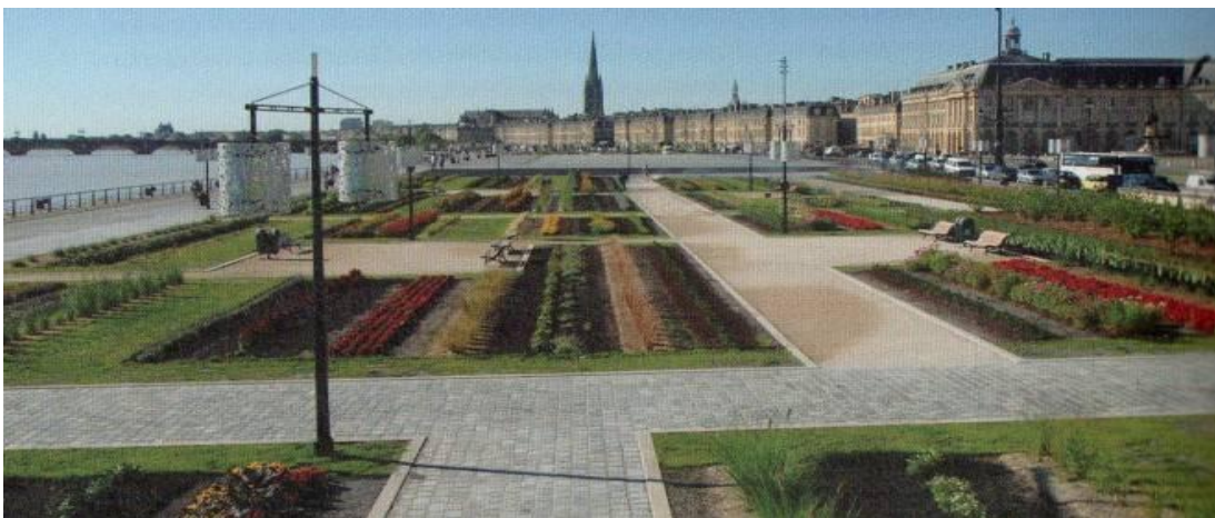
Les quais après le réaménagement