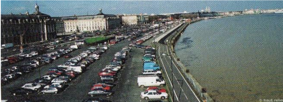
Les quais avant le réaménagement

l'image des grandes places rénovées dans Bordeaux, que ce soit la place de la Victoire, la place Pey-Berland ou encore la place de la Comédie qui ne sont agrémentées d'aucun espace de verdure.