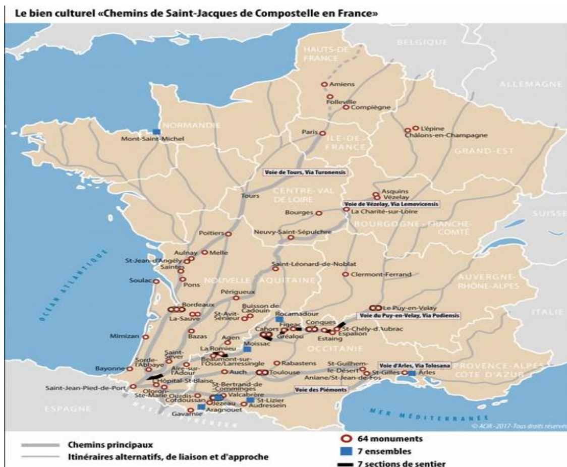
Figure 5 : Le bien 868 inscrit au patrimoine mondial de l'UNESCO