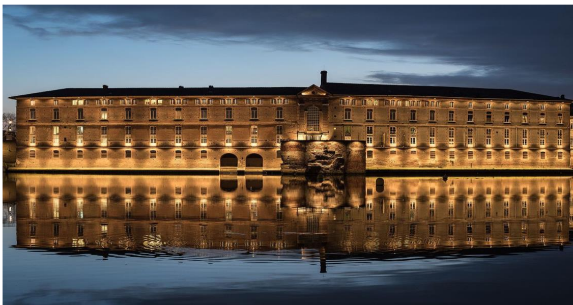
Figure 3 : L'Hôtel-Dieu de Toulouse, l'un des 64 monuments du bien 868, inscrit au patrimoine mondial de l'UNESCO, dit « chemins de Saint-Jacques-de-Compostelle en France »

d'accueil dans les villes et villages avec des haltes tous les trente kilomètres pour permettre l'essor et l'accueil des pèlerins. Il y a également en parallèle un enjeu politique qui est de valoriser l'image de Santiago de Compostella, et son incarnation iconographique Santiago Matamoros , figure mythique de la Reconquista espagnole. En 1257, les infrastructures qui bordent les chemins se renforcent avec la création des hôpitaux publics, dont l'Hôtel-Dieu de Toulouse (voir figure 3) est une construction emblématique. Ce monument est d'ailleurs inscrit au patrimoine mondial de l'UNESCO.