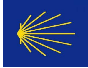
Figure 4 : Coquille Saint-Jacques stylisée jaune sur fond bleu, symbole du label « itinéraire culturel du Conseil de l'Europe » attribué aux chemins de Saint-Jacques-de-Compostelle