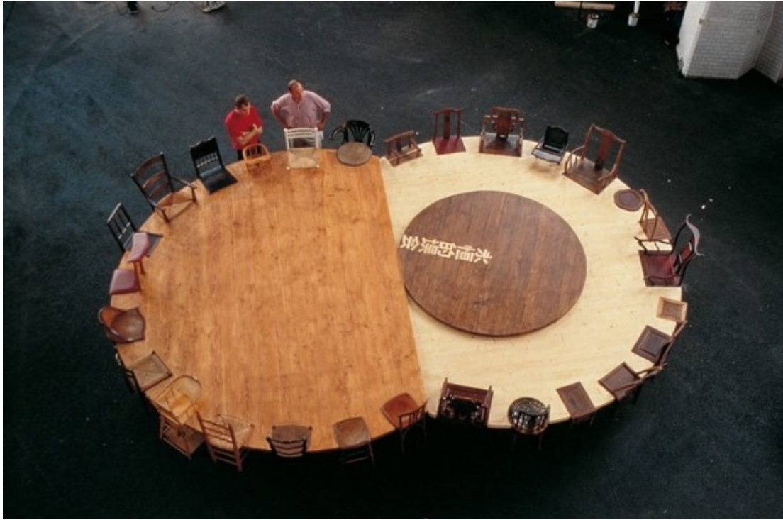
Figure 2 : Chen Zhen, Round Table - Side by Side , exposition l'Autre , Hall Tony Garnier, Lyon