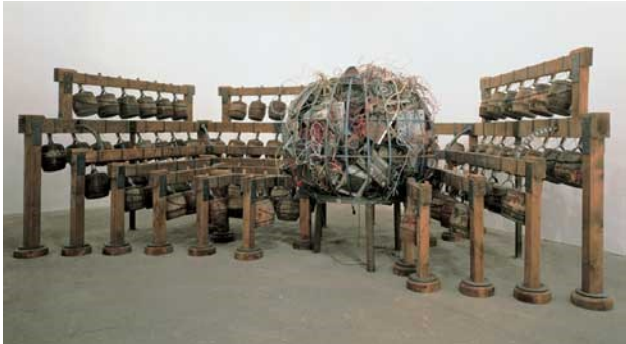
Figure 4 : Chen Zhen, Daily incantations , exposition Chen Zhen , CIAC-Centre international d'art contemporain de Montréal, Montréal