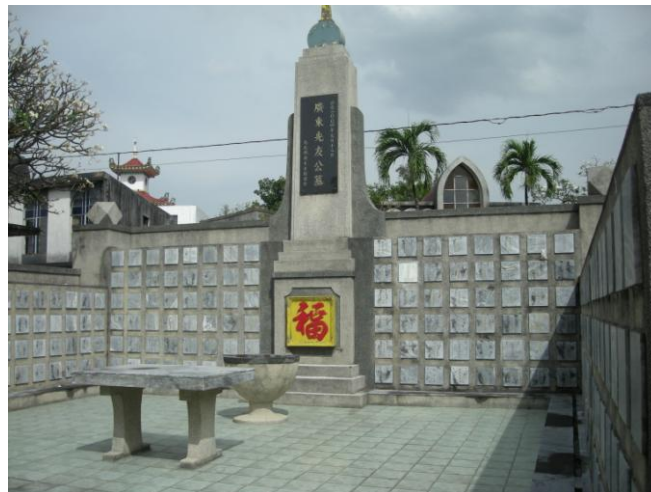
Cliché 2 : A l'intérieur du lot, la stèle dédiée aux Cantonais, accompagné du signe de la chance, les niches abritent les ossements ou les cendres des Cantonais (Février 2009)