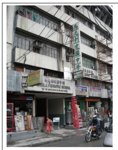
Cliché 4 : La façade du bâtiment de l'école cantonaise Manila Patriotic High School voisine avec des établissements commerciaux spécialisés dans les matériaux de construction au croisement des rues Soler et Tomas Mapua (cliché février 2009)