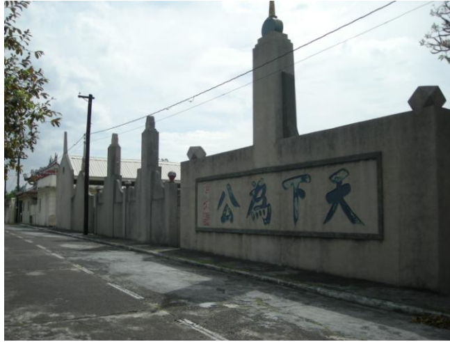
Cliché 1 : Dans le cimetière chinois de Manille, les Cantonais disposent d'un emplacement géré par l'Association des Cantonais. La citation de Sun Yat Sen « Tous les hommes sont égaux aux cieux » est inscrite sur le mur extérieur du lotissement mortuaire