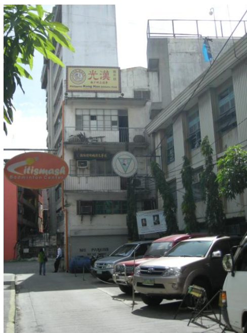
Cliché 3 : Le portrait de Sun Yat Sen sur la façade de l'école du même nom, rue Zacateros, Manila. (cliché février 2009)