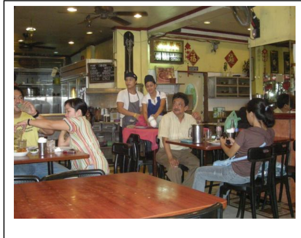
Cliché 5 : Restaurant cantonais dans la rue Florentino Torres, la spécificité cantonaise est uniquement énoncée en lettres romaines sur la façade de l'établissement, l'enseigne originale « Sun Wah » énonçant le nom de la famille propriétaire est disposé à l'intérieur.(cliché août 2010)