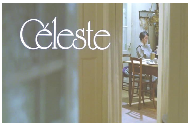
Ill. 1. Céleste (Percy Adlon, 1980)

communication entre la chambre et le reste de l'appartement est réduite aux quelques sons qui, tels les toussotements de l'écrivain, rappellent qu'une présence autre et quasi fantomatique vit là, quelque part, entre ces murs épais. Si tout le récit de Céleste est focalisé par les différentes actions du personnage éponyme, celles-ci sont en revanche toutes dirigées vers un seul et même lieu : vers cette chambre qui donne corps à l'écrivain.