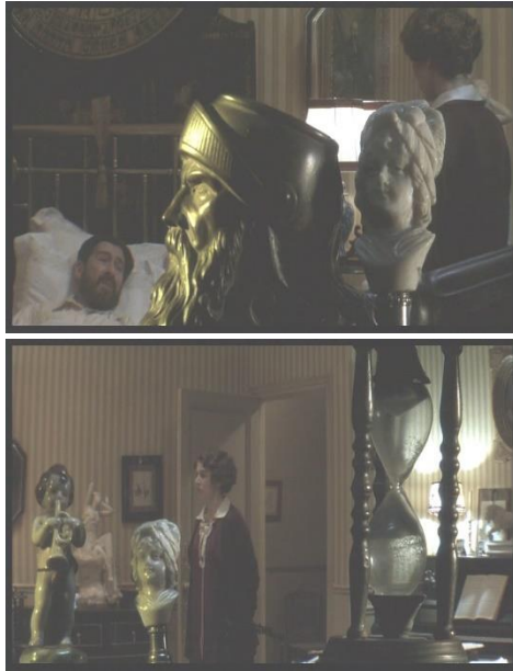
Ill. 25-28. Le Temps retrouvé (Raoul Ruiz, 1999)