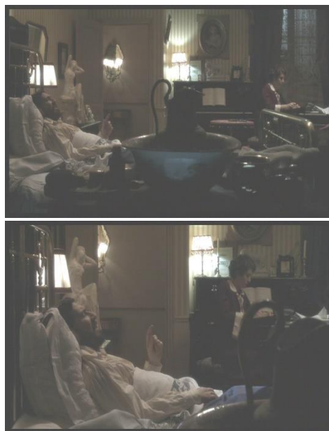
Ill. 11-12. Le Temps retrouvé (Raoul Ruiz, 1999)

fait voir et qui fait vivre. Franchir le seuil de cette nouvelle chambre proustienne revient ici à entrer dans un cerveau et, comme on tentera de le développer, dans une camera obscura , chambre noire où se fera la lumière.