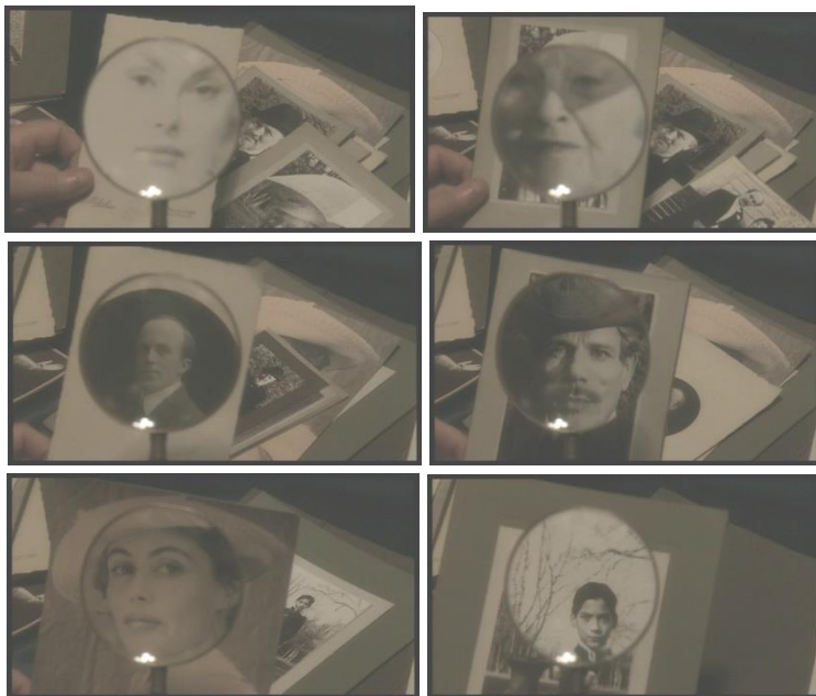
Ill. 19-24. Le Temps retrouvé (Raoul Ruiz, 1999)

mouvement et gagnera une consistance nouvelle. Le mystérieux auteur moribond cloué dans son lit peut ainsi être comparé à un démiurge, puisqu'il donnera vie à ces êtres qui, pour l'instant, sont privés de vie. La suite du récit va donc animer et donner corps à ces êtres qui, dans la chambre de l'écrivain, n'avaient d'existence que statique.