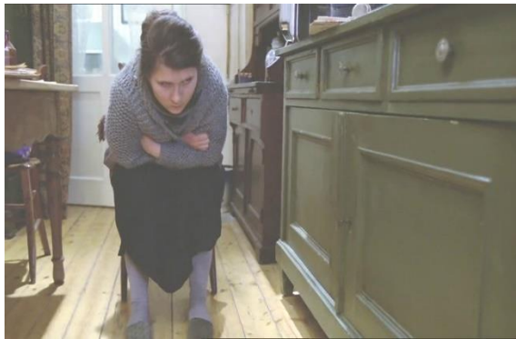
Ill. 6. Céleste (Percy Adlon, 1980)

là d'une méthode très efficace de mythification, réalisée à partir de moyens proprement cinématographiques. L'enregistrement « objectif » propre au dispositif cinématographique et à son ontologie de la « reproductibilité technique » (Benjamin) ne pouvant rendre compte de la nature du travail du romancier – activité qui perdrait tout son sens si elle était montrée –, Adlon a donc dû se tourner vers d'autres moyens, non moins redevables à l'esthétique du médium cinématographique, pour témoigner de la spécificité de cette tâche à laquelle Proust a consacré les dix dernières années de sa vie : si l'écriture ne peut se montrer, soit, elle demeurera cachée. Dans ce monde du visible que le cinéma crée en chaque film, ne pas voir est ainsi l'un des procédés cinématographiques les plus efficaces pour magnifier un personnage, un objet, ou une activité.