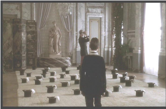
Ill. 29. Le Temps retrouvé (Raoul Ruiz, 1999)