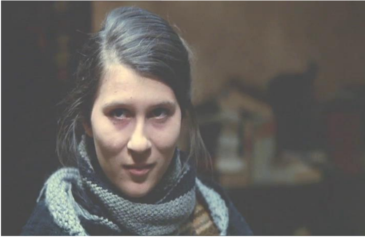
Ill. 9. Céleste (Percy Adlon, 1980)

En sortant de la chambre proustienne, épuisée comme si elle avait mené un dur combat, Céleste ne pourra s'empêcher d'esquisser un sourire.