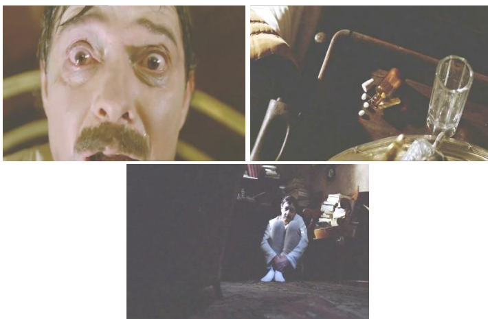
III. 3-5. Céleste (Percy Adlon, 1980)

d'eau qui tombent par terre), Céleste ne fait rien d'autre que produire des images de la chambre dans laquelle se trouve Monsieur. Lorsque celui-ci travaille, le temps s'arrête et l'espace perd sa productivité. Dans ces longs moments d'attente, la cuisine cesse d'être un lieu de travail (il n'y a plus de café à préparer, d'eau à faire bouillir ou de serviette à réchauffer) pour se transformer en lieu de chimères. Ce que la gouvernante perd ici en action, elle le réinvestit en fabulation. Céleste est un film contemplatif, à ceci près que ce n'est pas l'espace que nous contemplons, mais un personnage qui, lui-même, contemple le vide, de toutes ses forces, afin de mieux se projeter dans l'espace qu'une loi mystérieuse lui interdit. Sans en avoir la capacité, Céleste tente de se représenter le travail de l'écrivain, tâche indéchiffrable s'il en est.