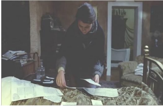
Ill. 7-8. Céleste (Percy Adlon, 1980)

Donner à voir la chambre ne peut se faire qu'au prix d'une disparition : celle de l'écrivain. Ce qui reste, c'est le texte.